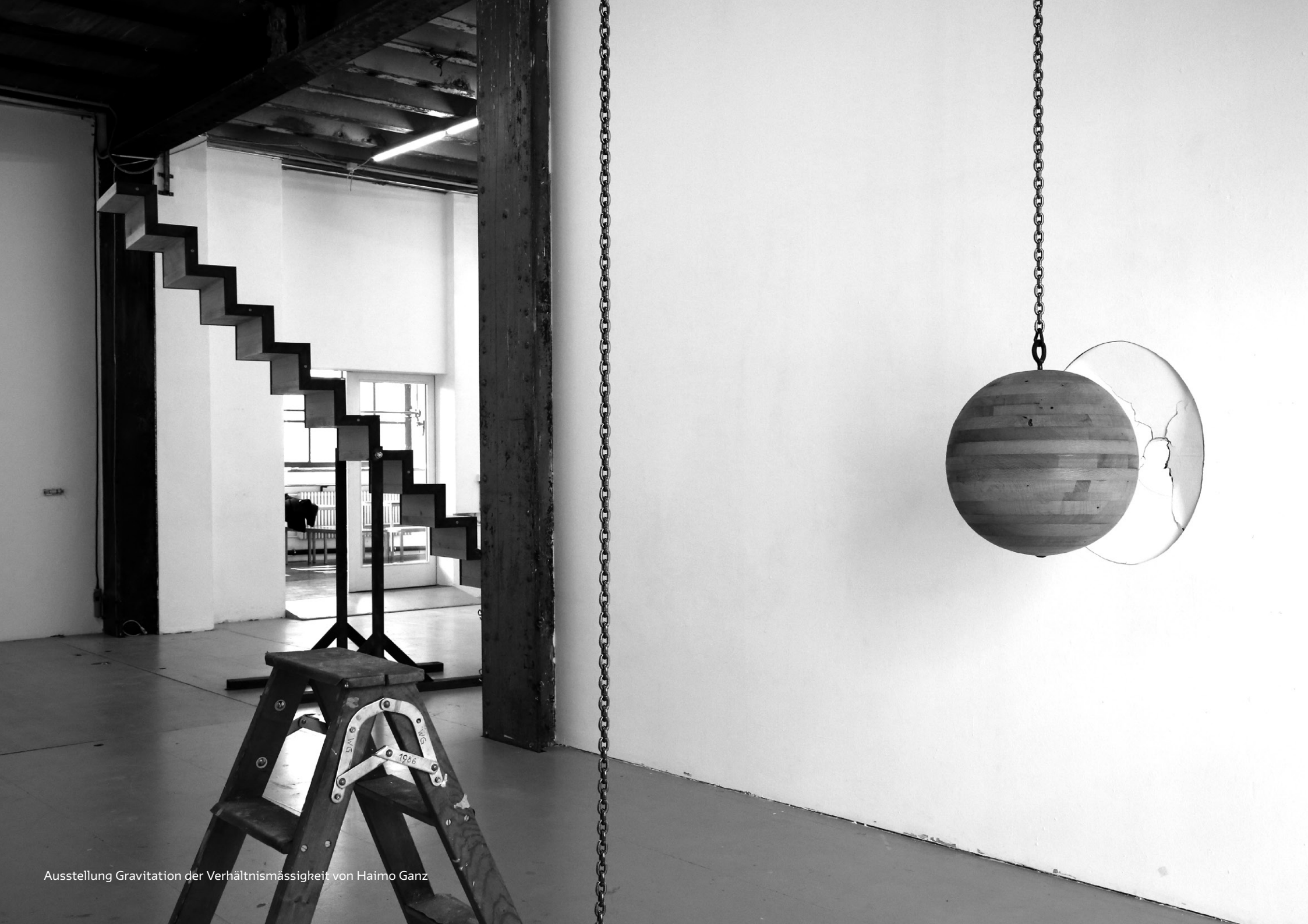
Ausstellung Gravitation der Verhältnismässigkeit von Haimo Ganz