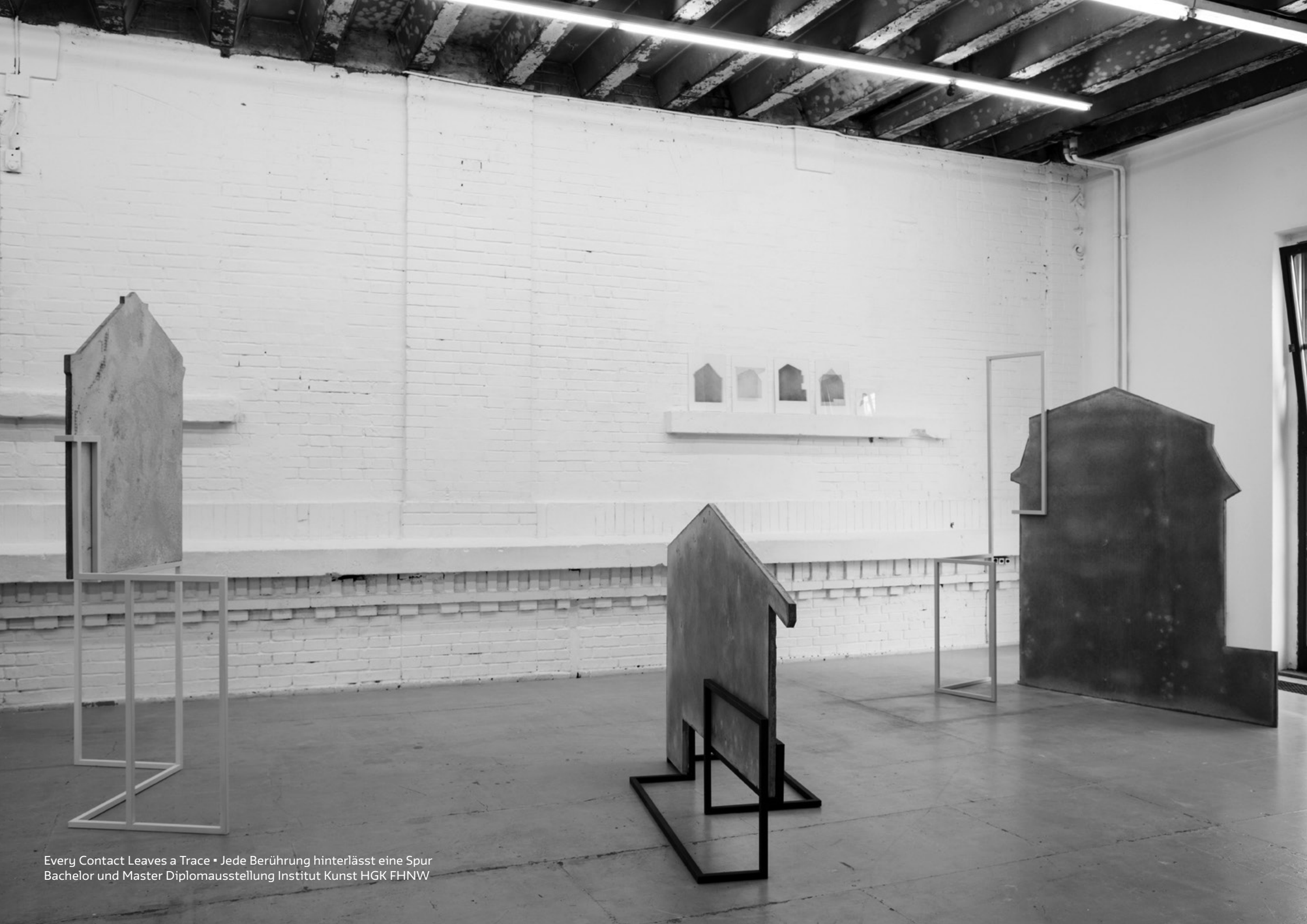
Every Contact Leaves a Trace • Jede Berührung hinterlässt eine Spur Bachelor und Master Diplomausstellung Institut Kunst HGK FHNW