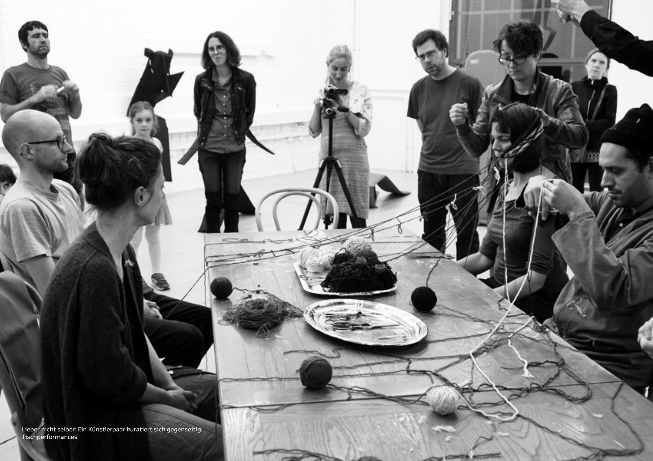
Lieber nicht selber: Ein Künstlerpaar kuratiert sich gegenseitig: Tischperformances