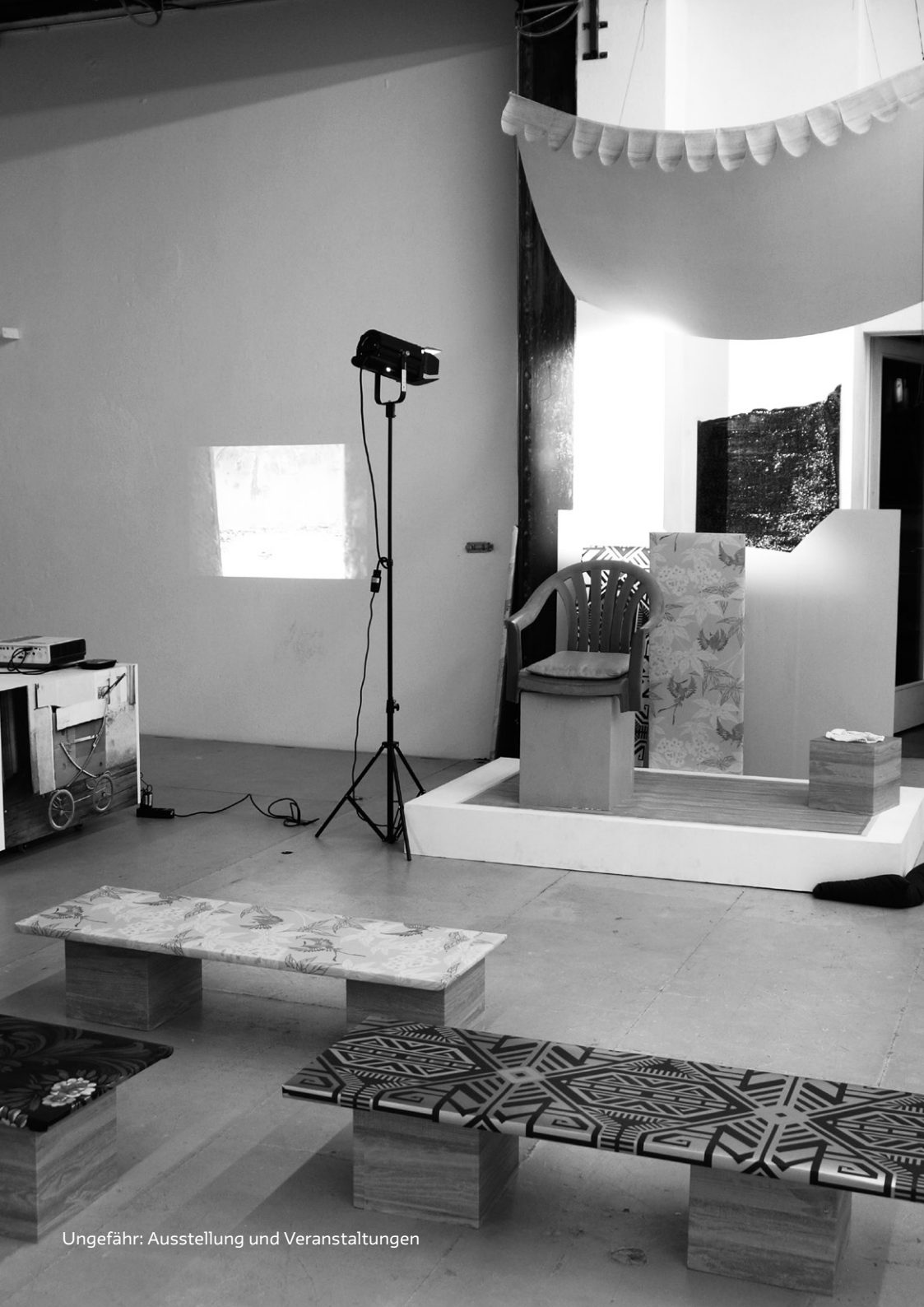
Ungefähr: Ausstellung und Veranstaltungen