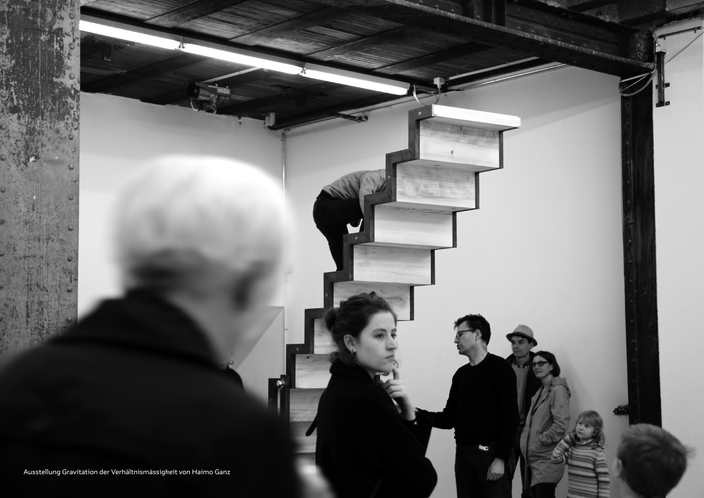
Ausstellung Gravitation der Verhältnismässigkeit von Haimo Ganz